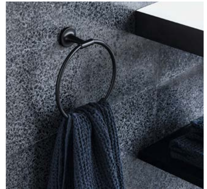
Anneau porte-serviette en noir mat.