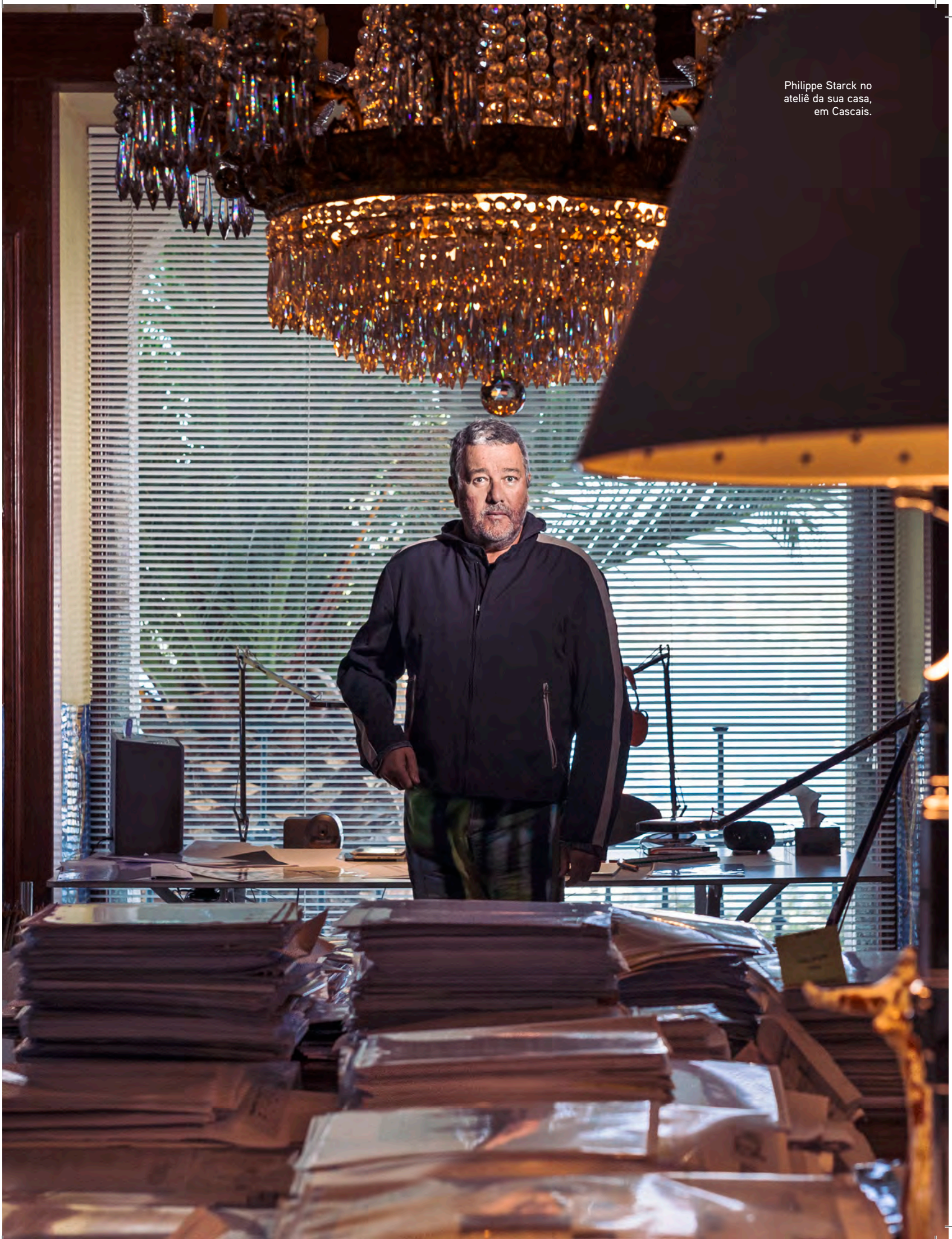
Philippe Starck no ateliê da sua casa, em Cascais.