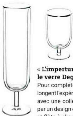
Collection l'Économe by Starck