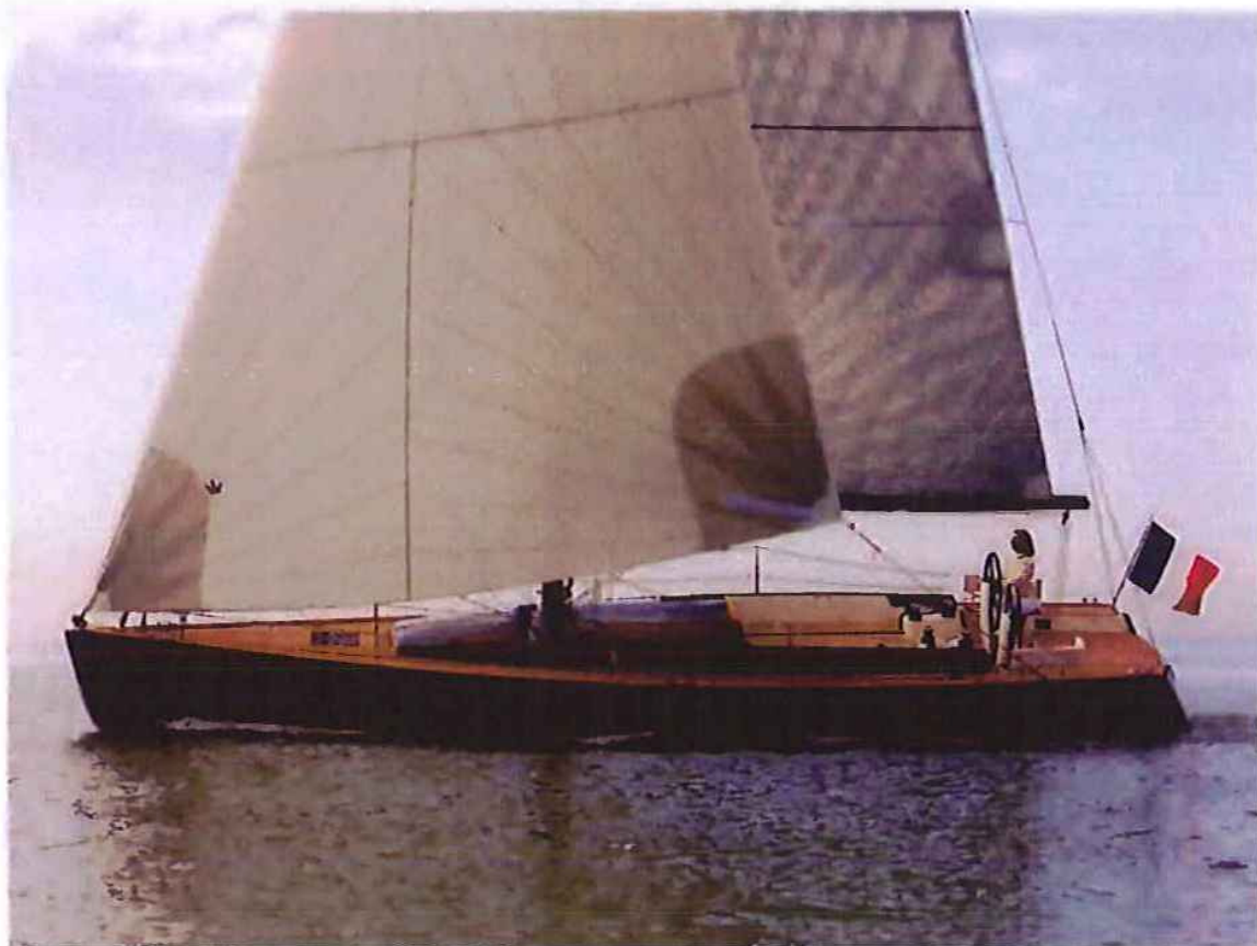
↑ Le Tofinou 12 standard déjà recouvert de tek et de vernis devient encore plus chic avec sa cabine signée Starck.

→ Pour styliser leurs embarcations, plusieurs chantiers navals ont recours au service de designers ou de skippers émérites. Starck à babord! Par Alexandre Lazerges