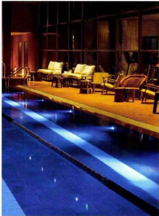
© Brach, Guillaume de L'aubier, Hembalem.