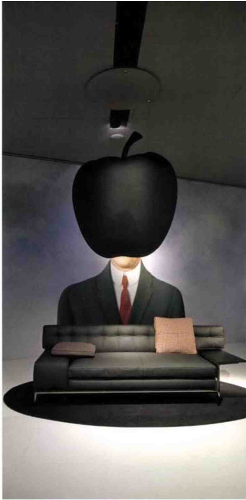
Canapé Volage EX-S Philippe Starck Apple Ten Lark 269 x 93 x H 74 cm 12 400 euros