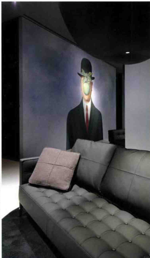
© Muyard / Cassina, Weipappee © Magritte