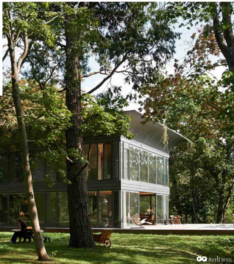
► L'habitat Starck façon Lego de luxe : la maison idéale sur mesure à faible coût, livrée clé en main.

Associé à l'entreprise slovène Riko, le designer français a planché six ans sur ce projet de maison modulaire et écologique, censée produire plus qu'elle ne consomme. Présenté cet automne, le prototype avait de la gueule – 350 m 2 de verre et d'acier, avec des éoliennes cachées dans le toit, des baies vitrées sur deux niveaux et une terrasse en bois. Au total, le catalogue propose 34 configurations différentes, dont toute une gamme de maisons de plain-pied. starckwithriko.com