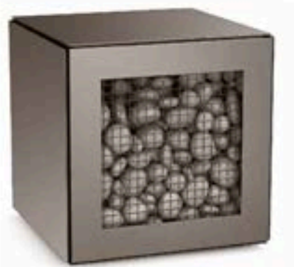
Accumulateur de chaleur 50 x 50 x 50