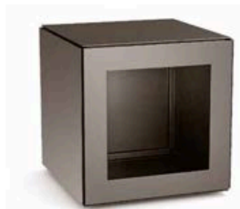
Rangement 50 x 50 x 50