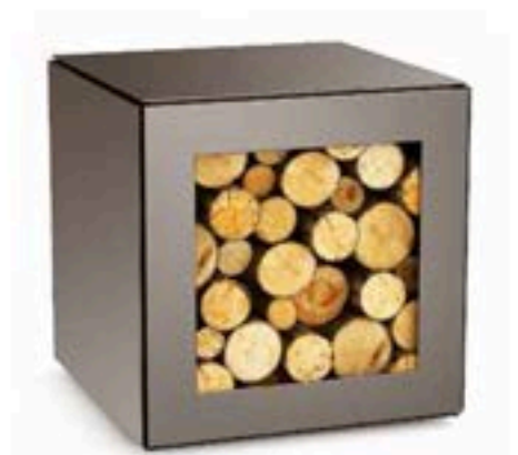
Range Bûches 50 x 50 x 50

Une box de rangement a été spécialement optimisée pour le stockage et le séchage du bois de chauffe. Cependant, utilisée en tabouret agrémenté d'un coussin ou comme étagère ou bibliothèque dans une composition de plusieurs modules, cette box peut accueillir vos livres et objets préférés.