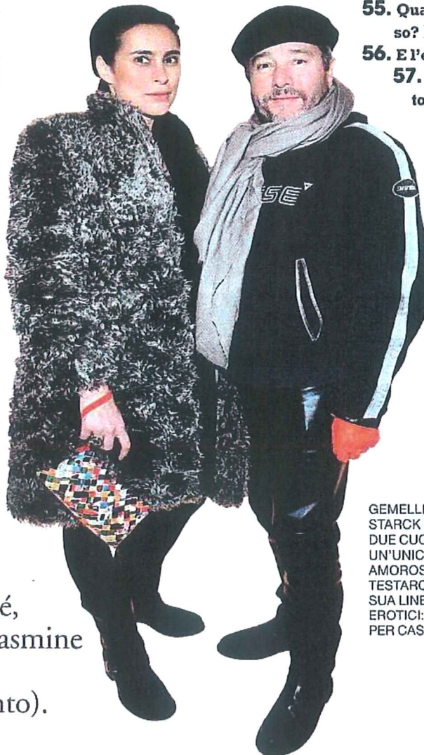
GEMELLI DIVERSI: STARCK E SIGNORA, DUE CUORI E UN'UNICA HOLDING AMOROSA. INSIEME TESTARONO LA SUA LINEA DI MOBILI EROTICI: "PRIVÉ" PER CASSINA.