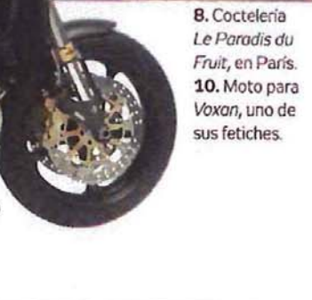
8. Coctelería Le Paradis du Fruit, en París. 10. Moto para Voxan, uno de sus fetiches.