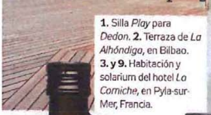
1. Silla Play para Dedon. 2. Terraza de La Alhóndiga, en Bilbao. 3. y 9. Habitación y solarium del hotel Lo Corniche, en Pyla-sur-Mer, Francia.