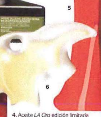
4. Aceite LA Oro edición limitada para LA Organic. 5. Altavoces inalámbricos Parrot by Starck. 6. Edición especial del perfume Air du Temps de Nino Ricci. 7. Espejo L'oreille qui voit para oX.