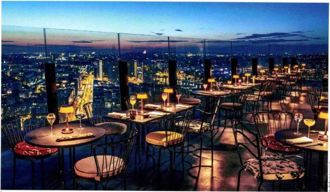
A 122 mètres du sol, le TOO TacTac Skybar tutoie les étoiles et se revendique comme le plus haut rooftop de Paris.