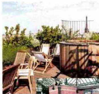
Le rooftop de l'hôtel Brach Paris. Le Marché Dauphine aux Puces de Saint-Ouen.