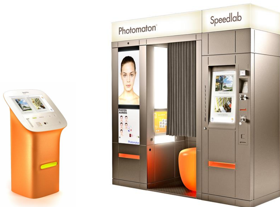
Speedlab BY S+ARCK

Grâce à ses deux nouvelles bornes interactives Speedlab BY S+ARCK , Photomaton renforce sa stratégie de proximité et enrichit son offre de services. En apportant une attention toute particulière au design et en simplifiant l'usage de ses bornes, il permet à l'utilisateur d'accéder en toute simplicité à un vaste catalogue de produits évolutifs et fait de celles-ci des alliées au quotidien.