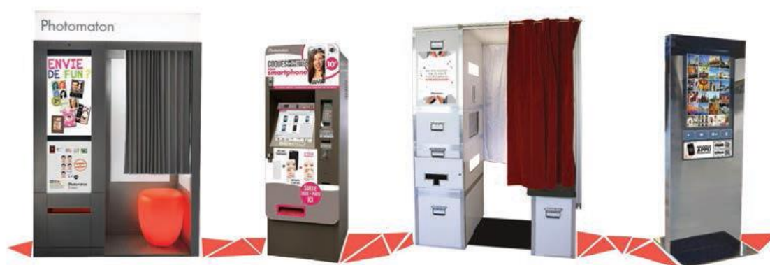
Photomaton + by Starck

Programmables en payant, gratuit ou avec des jetons, ces cabines ludiques et connectées sont 100% personnalisables.