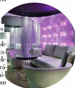
© Textos: IRENE SAN SEGUNDO Y BARBARA LORCA

El hotel Barceló Oviedo Cervantes ocupa una casa india (que cumple 100 años) rehabilitada, con dos torres de aspecto contemporáneo e interior minimalista. barcelo.com