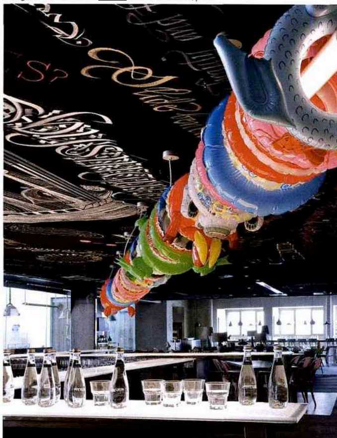
Design, chic et humour au Mama Shelter d'Istanbul, p. 74