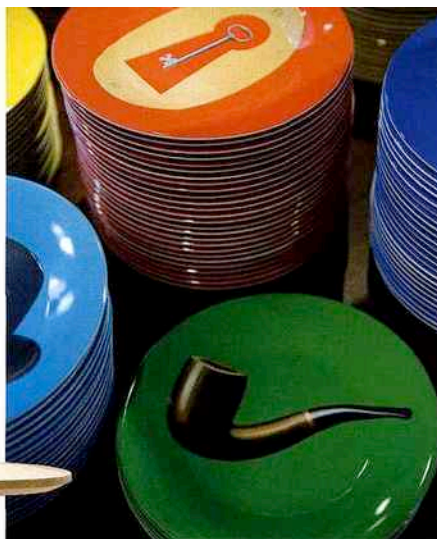
Tous à Bruxelles au Magritte Shop, p. 100

126 COLLECTIONMANIA Un parfum de Madeleine Castaing chez Armand Ventilato