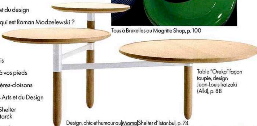
Table "Oreka" façon toupie, design Jean-Louis Irazzoki (Alki), p. 88