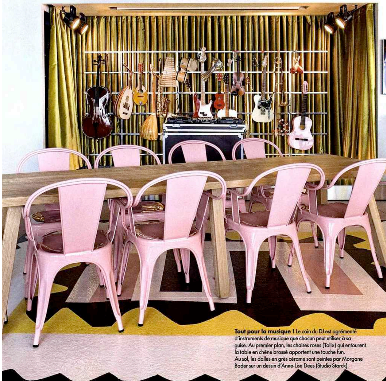
Tout pour la musique ! Le coin du DJ est agrémenté d'instruments de musique que chacun peut utiliser à sa guise. Au premier plan, les chaises roses (Tolix) qui entourent la table en chêne brossé apportent une touche fun. Au sol, les dalles en grès cérame sont peintes par Morgane Bader sur un dessin d'Anne-Lise Dees (Studio Starck).