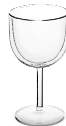
L'Imperturbable Verre à vin