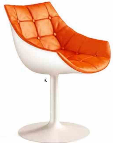
4. Caprice & Passion, Cassina © DR.