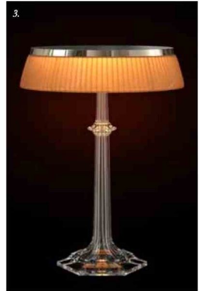
3. Bon Jour Versailles, Baccarat x Flos © DR.

Absolument, de façon cristalline et vertigineuse. Dessiner est assurément un des sports les plus drôles et des plus beaux. On ne demande rien à personne, on ne vole personne, il n'y a pas d'esclave, on fait tout soi-même avec son petit cerveau. On va creuser à l'intérieur de son subconscient, on fait émerger des choses. Alors, pourquoi s'embêter à taper dans un ballon ou battre des cartes. Je n'arrête jamais de travailler parce que c'est ce qu'il y a de plus passionnant.