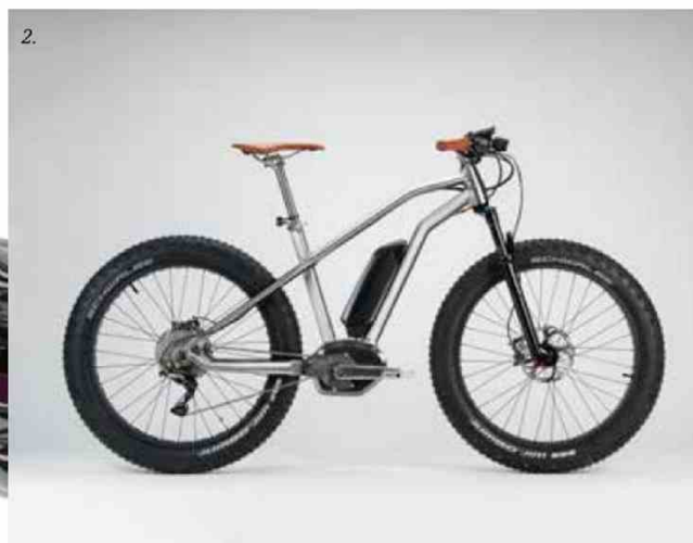
1. Mi MIX 2, Xiaomi — 2. Starck bike with Moustache, Mass collection, Snow modèle. Mass collection, Snow model