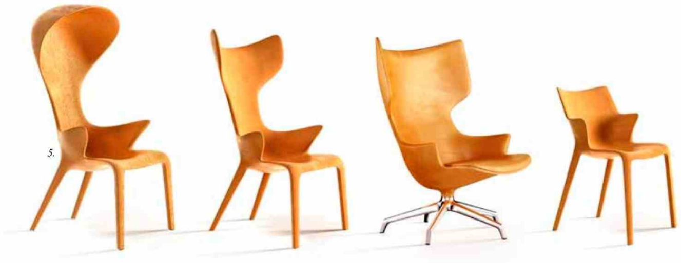
5. Lou Family, (Lou Think / Lou Read / Lou Speak / Lou Eat), Driade © DR.

who will use the object or live in a given place? I only wake up in the morning and set to work if there is some benefit to human beings, to us, to evolution. Is this project really interesting and how it can be brought to fruition in such a way as to make it elegant, ecological and economic?