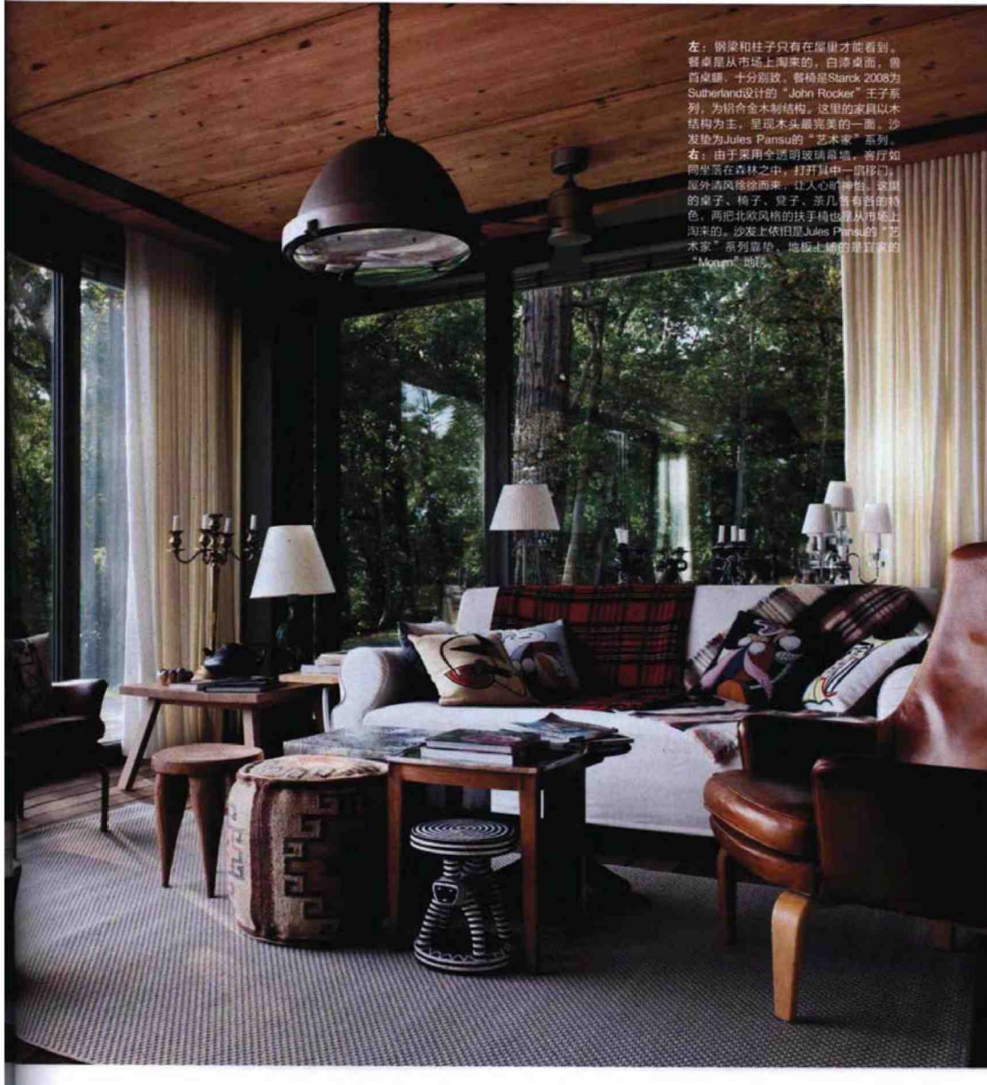
左：钢梁和柱子只有在屋里才能看到，餐桌是从市场上淘来的，白漆桌面，兽首桌腿，十分别致。餐椅是Stark 2008为Sutherland设计的“John Rocker”王子系列，为铝合金木制结构。这里的家具以木结构为主，呈现木头最完美的一面。沙发垫为Jules Pansu的“艺术家”系列。 右：由于采用全透明玻璃幕墙，客厅如同坐落在森林之中，打开其中一扇移门，屋外清风徐徐而来，让人心旷神怡。这样的桌子、椅子、凳子、茶几各有自己的特色，两把北欧风格的扶手椅也是从市场上淘来的。沙发上依旧用Jules Pansu的“艺术家”系列靠垫，地板上铺的是最爱的“Moum”地毯。