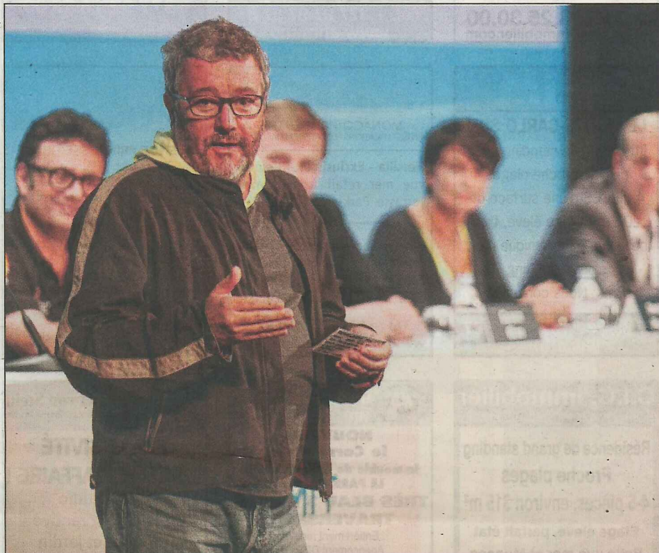
Le designer Philippe Starck a dévoilé sa vision du yachting de demain devant les quelque 250 participants du 1 er Monaco Yacht Summit.