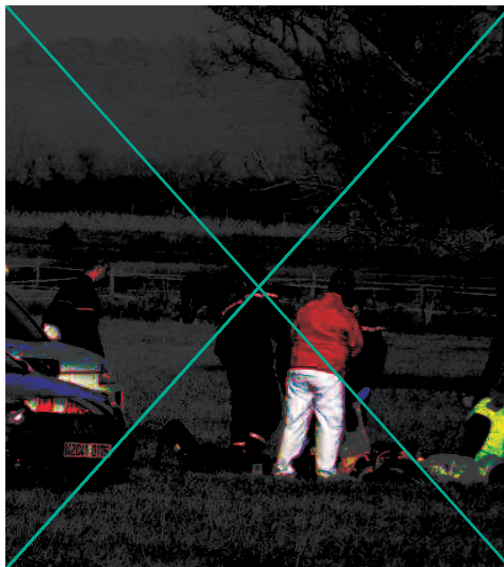
Hier vers 16 heures, près de l'aérodrome de Pamiers-les Pujols, les secours tentent de réanimer le moniteur. Hélas il a déjà succombé.

Un moniteur de 37 ans, du centre-école du Para-club de l'Ariège, à Pamiers-les Pujols, a trouvé la mort hier à l'occasion d'un saut. Il a eu des difficultés à ouvrir sa voileure • page 26