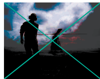
Un hélicoptère français à la frontière de la RCA.

Les troupes françaises ont été accueillies triomphalement par endroit. A Bangui, la journée a été calme, mais la peur demeure au sein de la population. • page 5