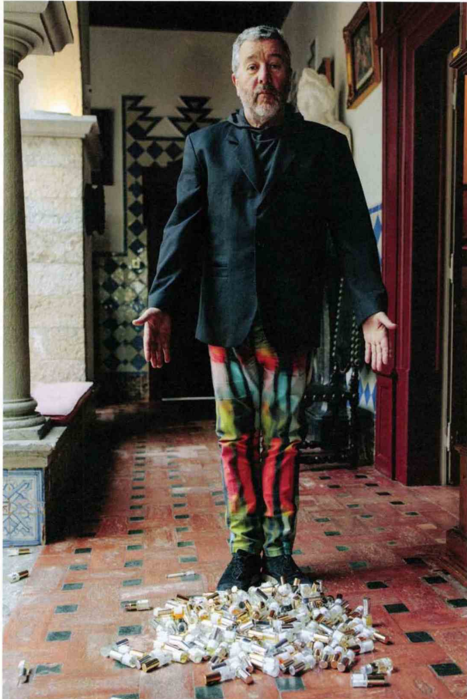
Philippe Starck no dudó en echar por tierra todos los frascos de esencias que ha utilizado para crear los perfumes de la línea Starck Paris.