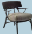
A.I. Lounge des. P. Starck