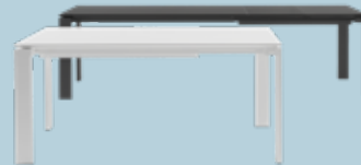
Four Family des. F. Laviani