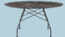
Glossy Family XXL des. A. Citterio