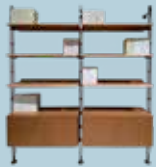
Adam Wood Container des. P. Starck