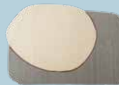
AAland des. P. Urquiola