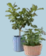
Corteza des. P. Urquiola